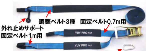
外れ止めサポート 固定ベルト1m用