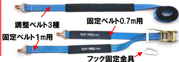
調整ベルト3種 固定ベルト1m用