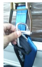
フックは金具で固定